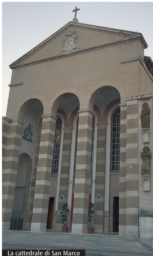
La cattedrale di San Marco