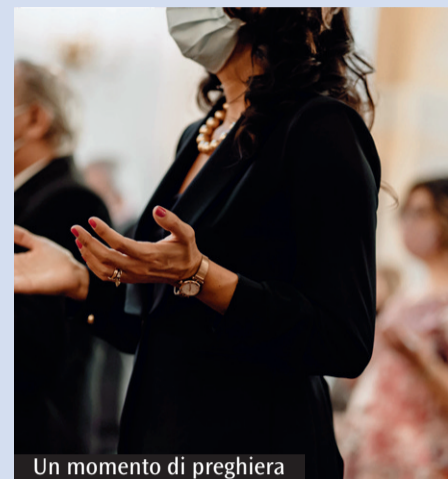
Un momento di preghiera