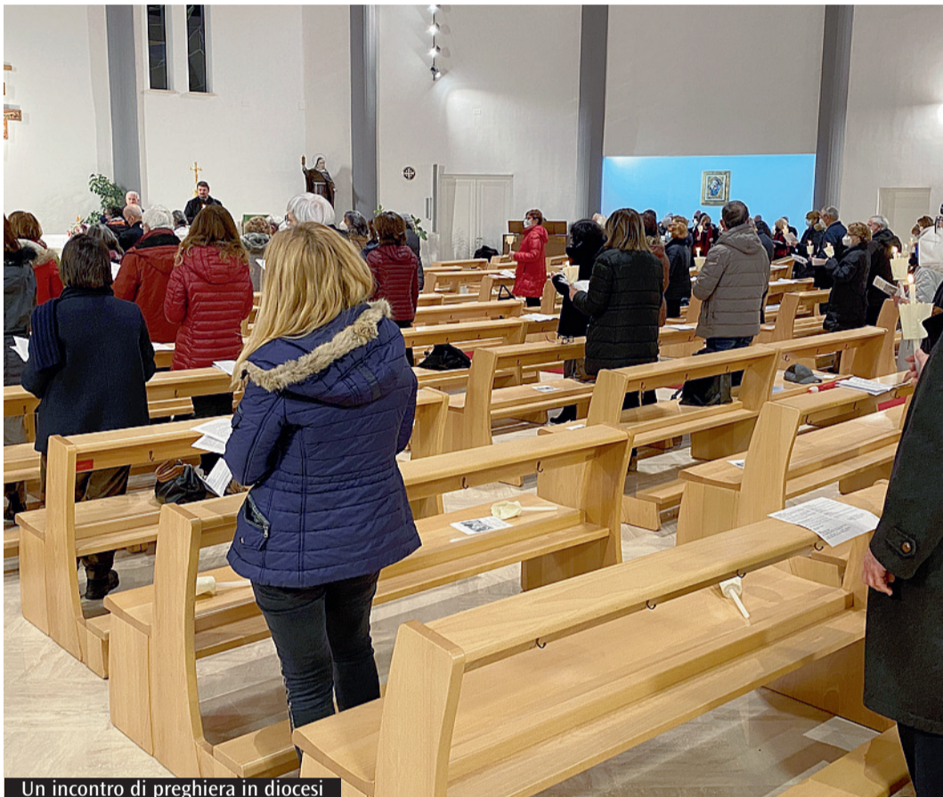
Un incontro di preghiera in diocesi

il Signore sta preparando. Si intuisce l'attualità di un messaggio che chiede di non perdersi dietro false consolazioni che evadono dalla realtà, ma di affrontarla in maniera attiva e propositiva, propria di chi sa che le conseguenze del proprio male possono essere vinte da una cooperazione viva con una promessa divina che solo nella partecipazione operosa si fa strada e si compie. Una seconda pagina coglie l'ascoltatore della