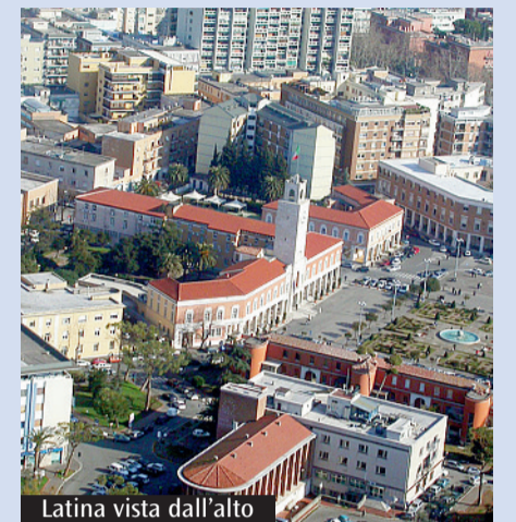
Latina vista dall'alto