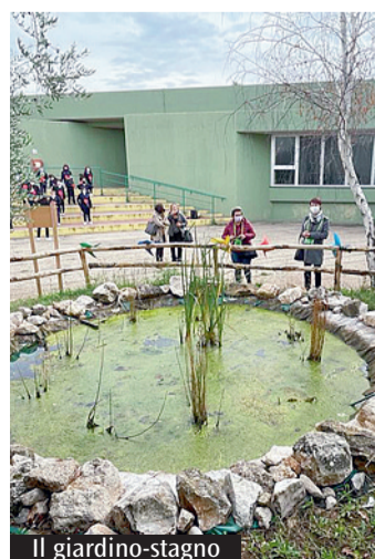
Il giardino-stagno Il progetto dell'Istituto "Donna Lelia Caetani" di Sermoneta, pensato per realizzare giardini e stagni