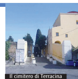
Il cimitero di Terracina

capire saggiamente che, al di là del distacco, siamo chiamati a pensare ai nostri cari, che il legame non è interrotto, perché essi vivono ancora. Il cimitero è il luogo dei morti. Se la visita ai nostri cari scomparsi può servire a lenire il dolore, non possiamo però accontentarci di questo. Noi vogliamo ancora bene ai nostri cari defunti, come loro ne vogliono a noi. Un bene che può e deve alimentarsi attraverso l'intercessione reciproca: la nostra preghiera per loro è importante, la loro per noi è vitale. Cristo, morto e risorto per