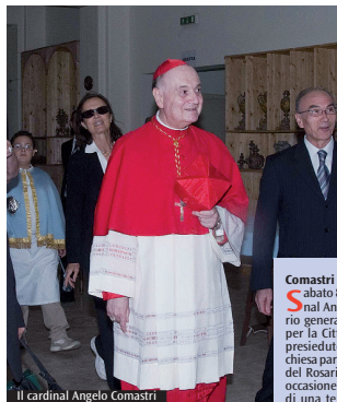
Il cardinal Angelo Comastri

ligiose, civili, e di tanto popolo desideroso di associarsi a questo nostro atto di pietà religiosa, il nostro umile e personale ossequio diventa pubblico e si fa cerimonia celebrativa». Con queste parole, pronunciate in uno stile inconfondibile per quanti lo conoscono, Paolo VI incominciava il suo discorso all'abbazia di Fossanova di fronte ad una folla traboccante ma composta, far gli onori di casa, naturalmente, l'allora vescovo diocesano monsignor Enrico Tomolo Compagnone, peraltro amico di lunga data di papa Montini, e con lui il presbitero della diocesi al gran completo, senza dimenticare le rappresentanze degli Ordini cistercense e domenicano, legati a doppio filo alla storia dell'abbazia medievale. Era un sabato, il 14 settembre 1974, e l'occasione - come abbiamo appena letto dalle parole stesse del Pontefice - era offerta dal 700° anniversario della scomparsa di San Tommaso, patrono della città di Priverno e compatriota della diocesi pontina. Tommaso, nato nella non lontana Roccaseca da una nobile famiglia dei conti di Aquino (non a caso proprio Roccaseca ed Aquino erano le altre due tappe obbligate della trasferta papale nel basso Lazio), si trovava in viaggio da Napoli, città in cui risiedeva a Lione, dove era in corso il concilio ecumenico e il suo parere di insigne teologo era particolarmente atteso. Avvertito un malore non molto tempo dopo esser partito, aveva dapprima chiesto ospitalità presso alcuni suoi familiari, nella cittadina lepina di Maenza;